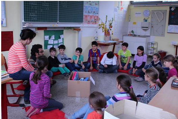
Kids for Kids in Deutschland

Dadurch möchte der Verein einen Beitrag zur Menschenrechtsdidaktik in Deutschland leisten. Die Schüler können dabei etwas über die katastrophale Situation der Menschen in Syrien erfahren und gemeinsam über Kinderrechte, Bildung, Säkularismus und Frieden diskutieren.